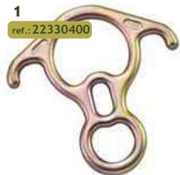
1 ref.: 22330400