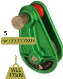
5 ref.: 22327803