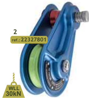
2 ref.: 22327801