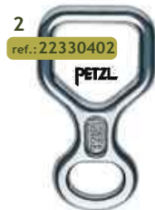
2 ref.: 22330402