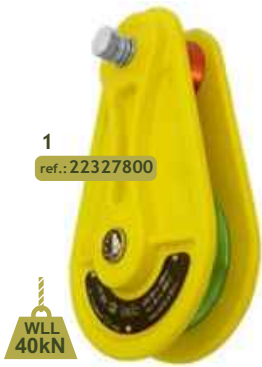
1 ref.: 22327800