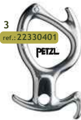
3 ref.: 22330401