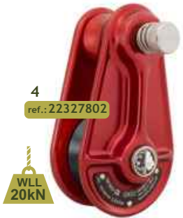
4 ref.: 22327802