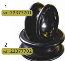
1 ref.: 22377701