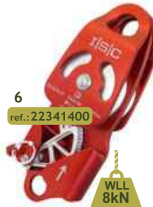
6 ref.: 22341400