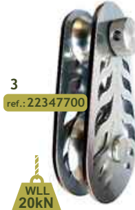
3 ref.: 22347700