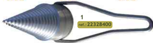
1 ref.: 22328400