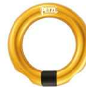
Anillos de Anclaje Aluminio con Apertura.