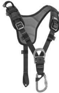
Sequoia SRT y Avao SIT