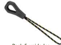
Pack 5 unidades.