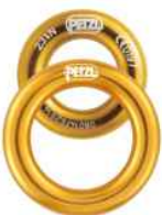
Anillos de Anclaje Aluminio

ref.: 22347900 23kN 28mm. S ref.: 22340900 23kN 46mm. L