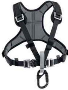
Sequoia SRT y Avao SIT