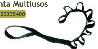
Cinta Petzl multiuso potros 9 bucles de 42cm.