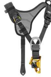
Sequoia SRT 10 a 13 mm.