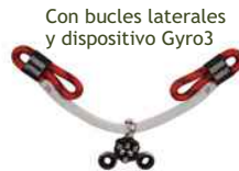
Con bucles laterales y dispositivo Gyro3