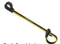
Pack 5 unidades.