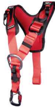
GT Sit y Tree Access EVO

ref.: 33216601 Talla S-L ref.: 33216602 Talla XL-XXL