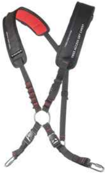
Tree Access EVO y ST